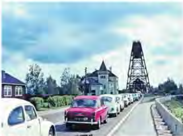
▲ File voor de Barendrechtse brug in 1969.

Die brug kwam er in het jaar 1888 en kreeg in de volksmond al snel de aanduiding 'Barendrechtse brug'. „Misschien vanwege de alliteratie, maar waarschijnlijk omdat de gewone Hoeksche Waarder in die tijd geen enkele waarde hechtte aan een brug”, denkt Arco van de Ree. Hij is auteur van het onlangs verschenen boek Baken in het Landschap vol ver-